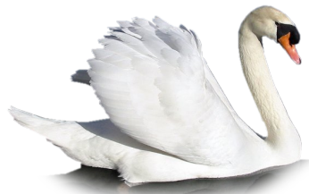
图 3: 竖排

图片并排 要实现并排的效果，可以有两种实现方式。一种是使用 子图 \subfloat[]{} 命令，若子图的尺寸得当，即子图宽度和不超过行宽，默认左右排序，如图 4所示。