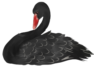
图 2: 竖排

图片竖排 \LaTeX 图片排版的逻辑是： 同一页面 下的图片根据引用顺序从上到下排列。图 2和图 3展示了图片 竖排 的效果。