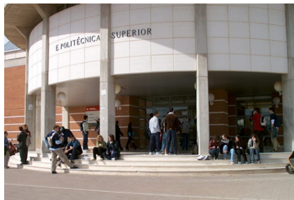
(a) Fotografía de la izquierda

Se incluye el paquete subfigure para la inclusión de figuras con varias imágenes o gráficas, como la que muestra la figura 2.3.