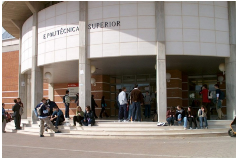
Figure 2.2: Escuela Superior de Ingeniería Informática. Esto es un texto descriptivo algo más largo que puede producir un efecto feo.