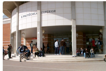
(b) Fotografía de la derecha