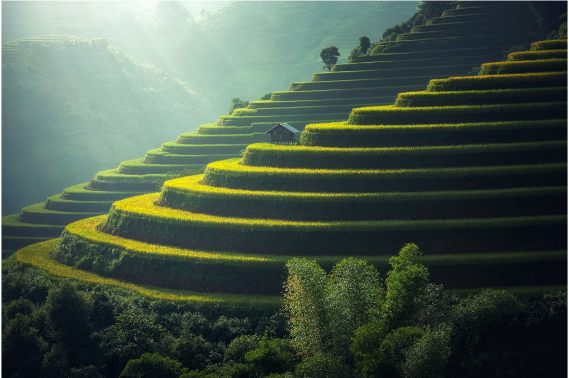
Figure 1: image description

consequatur aut perferendis doloribus asperiores repellat.