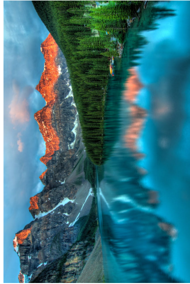
Figure 2: Image 3 Rotated 90 degrees clockwise.

Ut enim ad minima veniam, quis nostrum exercitationem ullam corporis suscipit laboriosam, nisi ut aliquid ex ea commodi consequatur? Quis autem vel eum iure reprehenderit, qui in ea voluptate velit esse, quam nihil molestiae consequatur, vel illum, qui dolorem eum fugiat, quo voluptas nulla pariatur? Nam libero tempore (Figure 2), cum soluta nobis est eligendi optio, cumque nihil impedit,