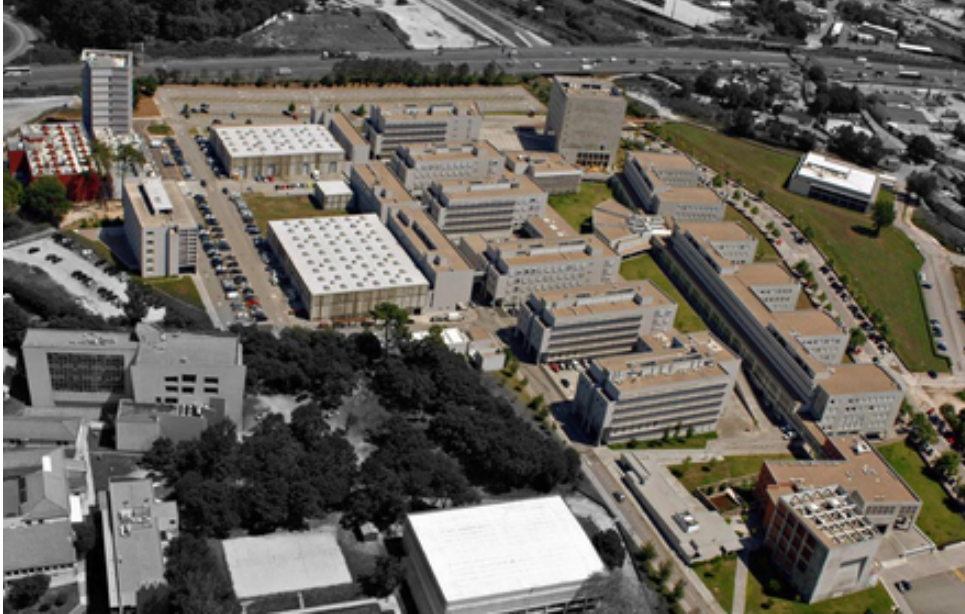
Figura 2.1: Fotografia aérea do Campus da FEUP (Espaço de Arquitetura 2020).