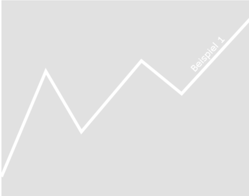
Abbildung 1.1: Beispiel 1 zum Einfügen einer Grafik

hac habitasse platea dictumst. Curabitur at lacus ac velit ornare lobortis. Curabitur a felis in nunc fringilla tristique.