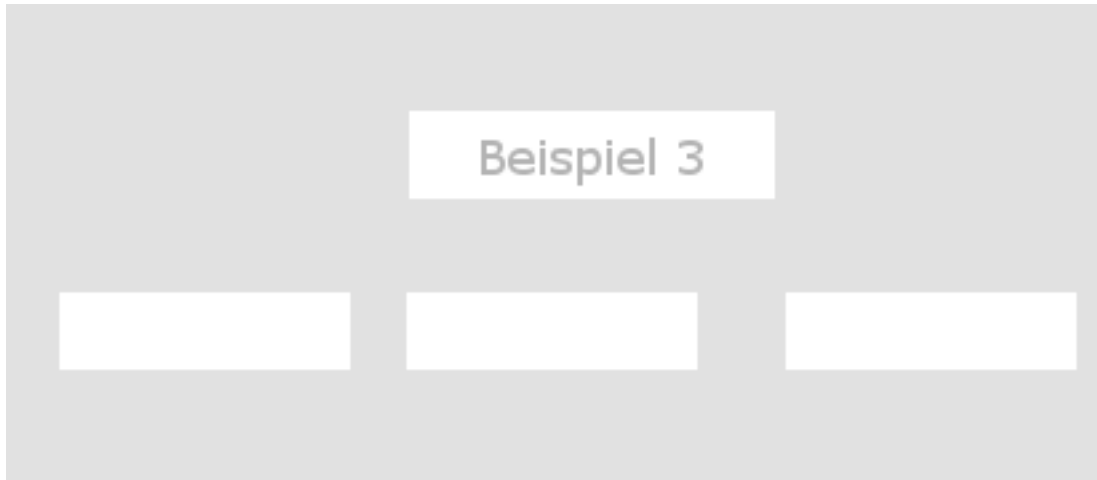
Abbildung 3.1: Beispiel 3 zum Einfügen einer Grafik

hendrerit quis, nisi. Curabitur ligula sapien, tincidunt non, euismod vitae, posuere imperdiet, leo. Maecenas malesuada.