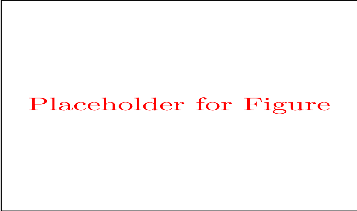
Figure 1: Caption goes here.